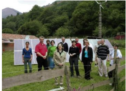
Segunda reunión del proyecto en Lastur, Guipúzcoa.

El proyecto está siendo elaborado por siete socios Europeos que son los siguientes: GERTEC/B.S.U. Berlín (Alemania), O.Ö. ESV Oberösterreichischer Energiesparverband (Austria), AESS - Agencia per l'Energia e lo Sviluppo Sostenibile (Italia), ApE Energy Restructuring Agency (Eslovenia), Energikontor Sydost - Energy Agency for Southeast Sweden (ESS) (Suecia), South Western Services Group Ltd (Irlanda) y Prospektiker (España).